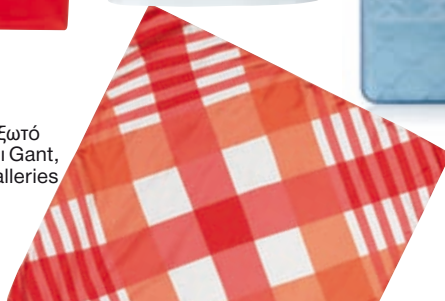
Μεταξωτό foulardi Gant, notosgalleries