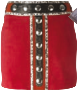
Suede φούστα Roberto Cavalli, Luisa World