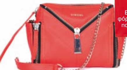
Δερμάτινη τσάντα, Diesel