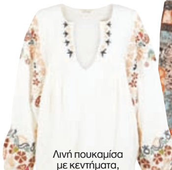
Λινή πουκαμίσια με κεντήματα, Monsoon