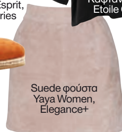
Suede φούστα Yaya Women, Elegance+