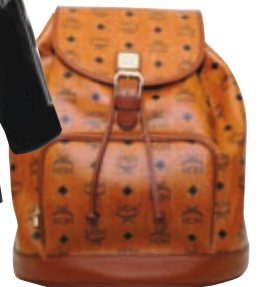
Δερμάτινο backpack Mcm, Attica - The Department Store