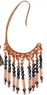
Σκουλαρίκι από επιχρυσωμένο ασήμι με χάντρες, Β Σαλίκας