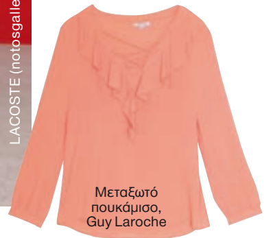
Μεταξωτό πουκάμισο, Guy Laroche