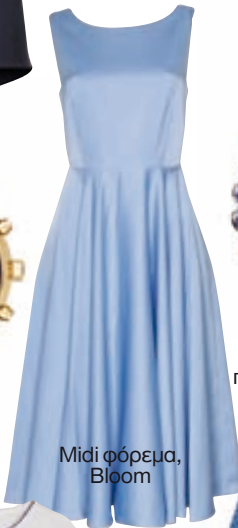
Midi φόρεμα, Bloom