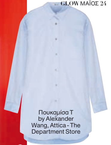
Πουκαμίσια T by Alexander Wang, Attica - The Department Store