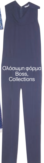
Ολόσωμη φόρμα Boss, Collections