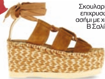
Suede πλατφόρμα Palomitas, Galleria di Scarpe