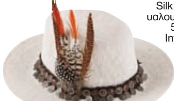
Καπέλο με φλουριά και φτερό, Bloom