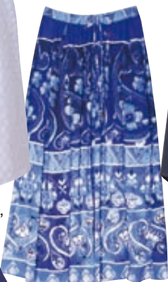
Πλισέ μάξι φούστα Desigual, Shop Ilisia