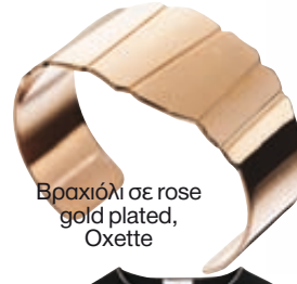
Βραχιόλι σε rose gold plated, Oxette