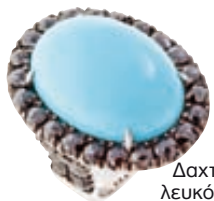
Δαχτυλίδι σε λευκόχρυσο με πολύτιμους λίθους, Thalia Exarchou Jewellery