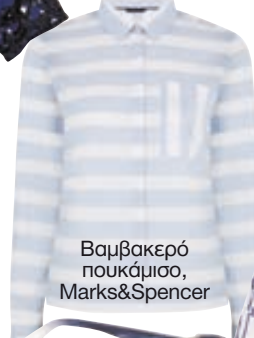
Βαμβακερό πουκάμισο, Marks&Spencer