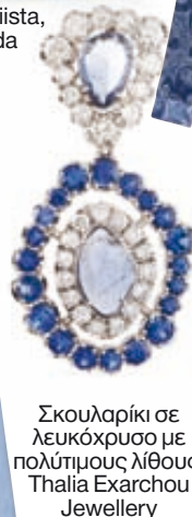
Σκουλαρίκι σε λευκόχρυσο με πολύτιμους λίθους, Thalia Exarchou Jewellery