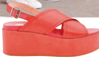
Δερμάτινη πλατφόρμα Ras, Fratelli Karida