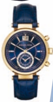
Ρολόι, Michael Kors