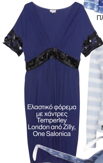
Ελαστικό φόρεμα με χάντρες Temperley London από Zilly, One Salonica