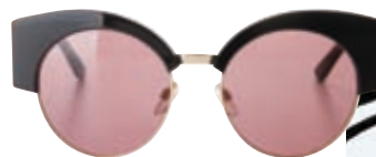
Γυαλιά ηλίου Kaleos, Οπτικά Παυλίδης