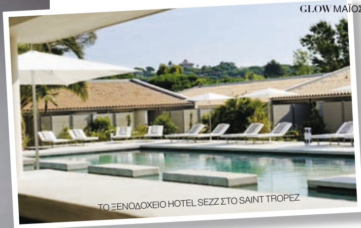
ΤΟ ΞΕΝΟΔΟΧΕΙΟ HOTEL SEZZ ΣΤΟ SAINT TROPEZ