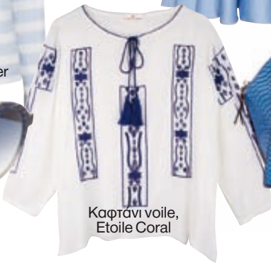
Καρφάνι voile, Etoile Coral