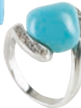
Δαχτυλίδι με τirkουάζ, A. Gatsos

Είναι τα πιο λατρεμένα χρώματα αυτής της άνοιξης και συνδυάζονται υπέροχα μεταξύ τους. Για τις τολμηρές fashionistas που δε διστάζουν να πειραματιστούν και να διαφέρουν, η άνοιξη σας καλεί να νιώσετε τη φρεσκάδα της στο έπακρο!