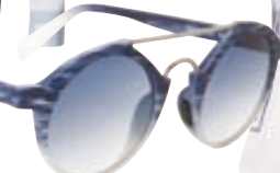
Γυαλιά ηλίου Italia Independent, Look Optical