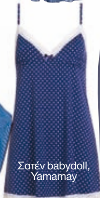
Σατέν babydoll, Yamamay