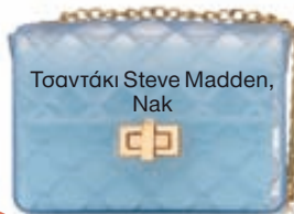
Τσαντάκι Steve Madden, Nak