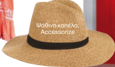
Ψάθινο καπέλο, Accessorize