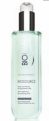
LOTION ΓΙΑ ΤΟ ΠΡΟΣΩΠΟ ΓΙΑ 24ΩΡΗ ΕΝΥΔΑΤΩΣΗ BIOSOURCE ΤΗΣ BIOTHERM, ΑΤΤΙΚΑ - THE DEPARTMENT STORE

Με απόλυτα ανοιξιάτικη διάθεση και αναμένοντας την καλοκαιρινή σεζόν, οι αποχρώσεις γίνονται πιο pastel, με το μπλε του ουρανού και της θάλασσας να έχουν ρόλο πρωταγωνιστικό στην γκαρνταρόμπα μας. ΕΠΙΜΕΛΕΙΑ - ΚΕΙΜΕΝΟ ΕΛΕΟΝΩΡΑ ΚΑΝΑΚΗ