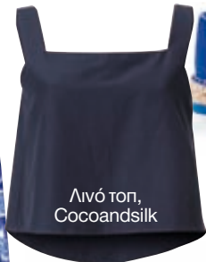
Λινό top, Cocoandsilk