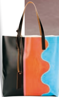
Τσάντα Marni, Intervista