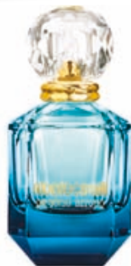
ΑΡΩΜΑ PARADISO AZZURRO ROBERTO CAVALLI, NOTOGALLERIES