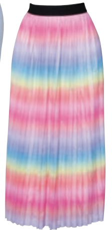
Βαμβακερή ηλιό φούστα Ziztar, Elegance+