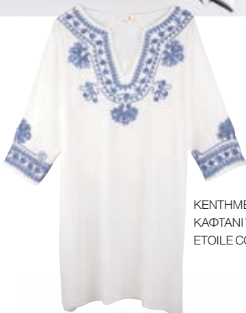
KENTHMENO ΚΑΦΤΑΝΙ VOILE, ETOILE CORAL