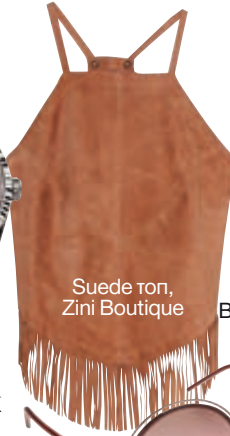
Suede top, Zini Boutique