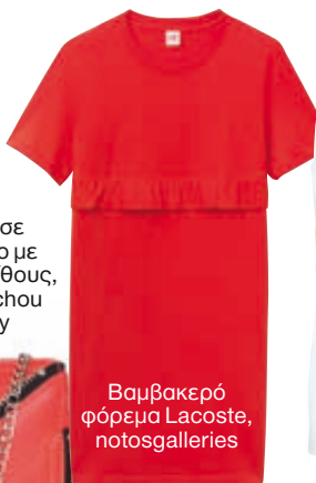
Βαμβακερό φόρεμα Lacoste, notosgalleries