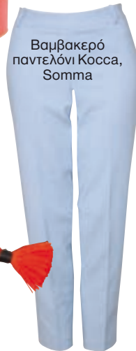
Βαμβακερό παντελόνι Kocsa, Somma