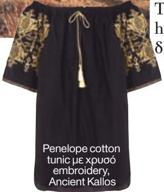
Penelope cotton tunic με χρυσό embroidery, Ancient Kallos

Το πιο hot μουσικό φεστιβάλ στην Καλιφόρνια, με την πολύχρωμη hippy ατμόσφαιρα και τις αιθέριες παρουσίες απ' όλο τον πλανήτη, δίνει μαθήματα boho style για άνετες και σέξι μποέμ εμφανίσεις.