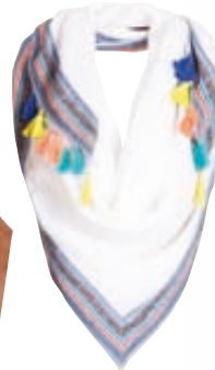
Βαμβακερό φουλάρι MAT, shop.matfashion.com