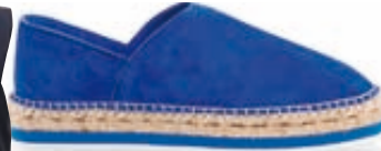
Εσπαντρίγια Miista, Fratelli Karida