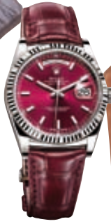
Ρολόι σε λευκόχρυσο 18K Rolex Day Date, Gofas, Art&Style Vildiridis