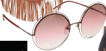
Γυαλιά ηλίου Marc Jacobs, Οπικά Παυλίδης