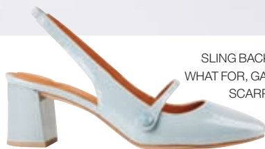
SLING BACK ΓΟΒΑ WHAT FOR, GALLERIA DI SCARPE