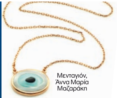
Μενταγιόν, Άννα Μαρία Μαζαράκη