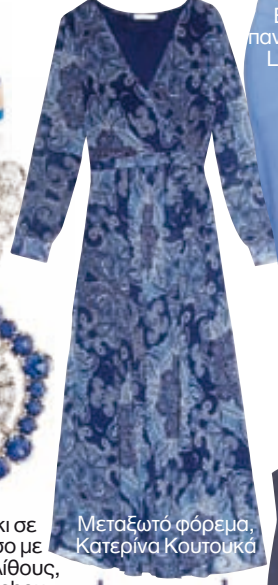
Μεταξωτό φόρεμα, Κατερίνα Κουτουκά