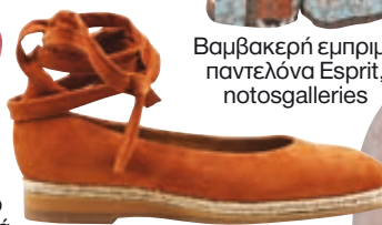
Suede lace up μπαλαρίνα, Pargiana Shoes