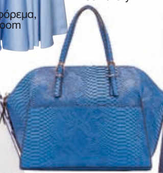
Δερμάτινη τσάντα, Carpisa