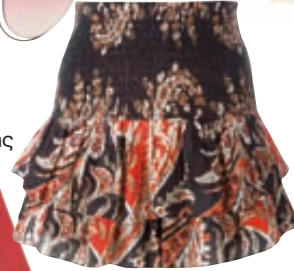
Φούστα Isabel Marant, Grigio