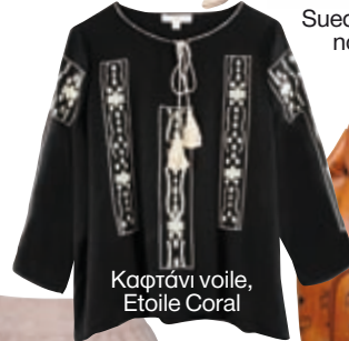
Καρτάνι voile, Etoile Coral