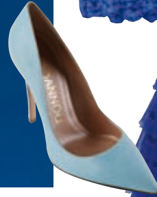
Δερμάτινη γόβα, Ioannou