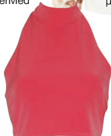
Crop top από ελαστικό ύφασμα boing με χρυσά κουμπιά γύρω από τον λαιμό και τη μέση, The Mannequin Collection