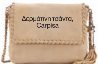
Δερμάτινη τσάντα, Carpisa