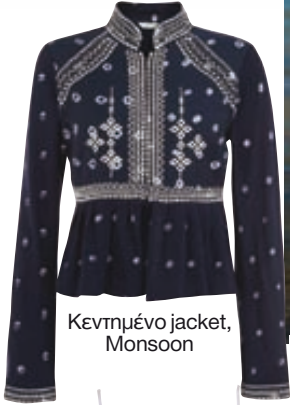
Κεντημένο jacket, Monsoon