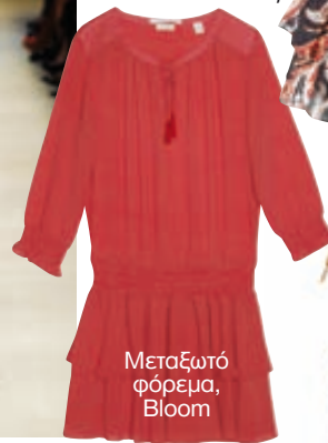
Μεταξωτό φόρεμα, Bloom