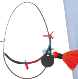
Σκουλαρίκι Bobo earring silver με κοράλλι και turquoise, Katerina Ioannidis