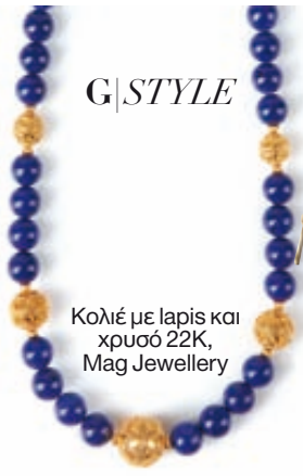
Κολιέ με lapis και χρυσό 22K, Mag Jewellery