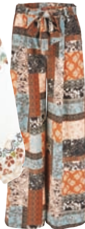
Βαμβακερή εμπριμέ παντελόνια Esprit, notosgalleries