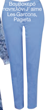
Βαμβακερό παντελόνι J' aime Les Garçons, Pagieta