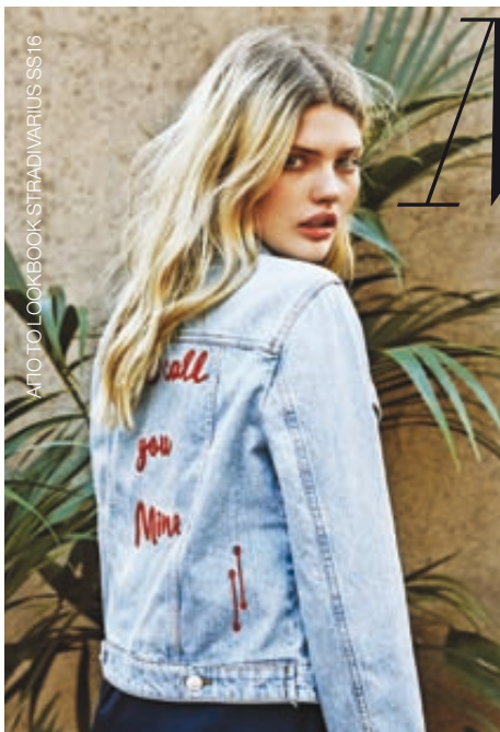
ΑΠΟ ΤΟ LOOKBOOK STRADIVARIUS SS16

Με τους σχεδιαστές και τους οίκους μόδας να έχουν ήδη παρουσιάσει, κάποιους μήνες πριν, τις τάσεις για Άνοιξη/ Καλοκαίρι 2016, που αυτήν τη στιγμή κυριαρχούν, ο μαζιμαλισμός της μόδας συναντά καθετί ρομαντικό, όπως λανσάρι και το romantic look του Alexander McQueen και του Erdem. Την ίδια στιγμή, eye-catching ρούχα και αξεσουάρ έχουν την τιμηκή τους, ενώ κλασικά στοιχεία μεταλλάσσονται μ' ένα μοντέρνο και, πάνω απ' όλα, ανοιξιάτικο inspired mood. Όλα έχουν μια αισιόδοξη ματιά. Βοηθάει, άλλωστε, και η εποχή που το μαύρο δίνει τη θέση του στο χρώμα, στα prints, σ' έντονες και απαλές αποχρώσεις. Κάπου εκεί η παλέτα της μόδας γεμίζει από πινελιές του μπλε και το λεγόμενο baby blue «μπαίνει» δυναμικά στο παιχνίδι του σιλ και ντύνει χρωματικά όλες τις τάσεις. Είναι που και ο ουρανός γίνεται πιο γαλανός, η θάλασσα αποκτά το ονειρικό παστέλ της χρώμα και όλα συνθέτουν ένα ρομαντικό, αλλά και σύγχρονο σκηνικό. Ο οίκος Christian Dior υιοθέτησε το συγκεκριμένο χρώμα σε