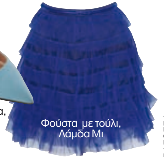
Φούστα με τούλι, Λάμδα Μι