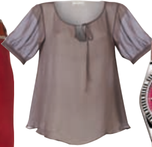
Μεταξωτή μπλούζα, Cocoandsilk