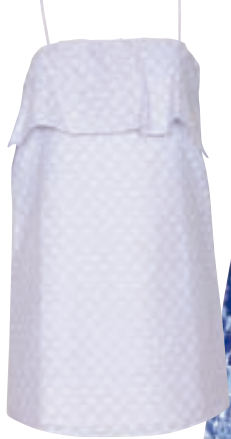
Φόρεμα Blossan, La Coquette

Η χρωματική παλέτα του μπλε είναι τόσο μεγάλη που σίγουρα θα βρείτε την απόχρωση που σας ταιριάζει. Από το γλυκό και αθώο γαλάζιο μέχρι το έντονο ocean blue, δημιουργούν δροσερές και άκρως καλοκαιρινές εμφανίσεις.