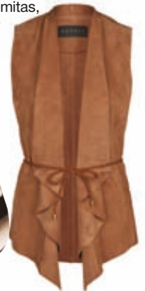
Suede γιλέκο Esprit, notosgalleries