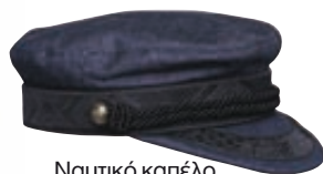
Ναυτικό καπέλο Zadig&Voltaire, Attica - The Department Store