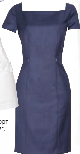
Φόρεμα Boss, Collections