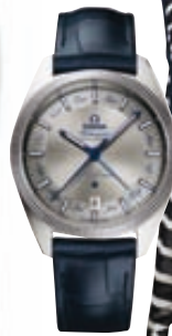
Ρολόι Globemaster Annual Calendar, Omega