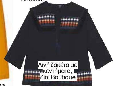
Λινή ζακέτα με κεντήματα, Zini Boutique