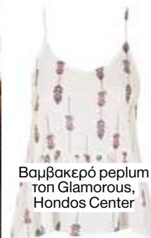
Βαμβακερό rperlum τοπ Glamorous, Hondos Center