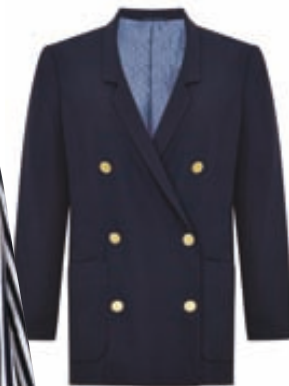
Βαμβακερό σακάκι Alexa Chung, Marks&Spencer