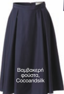
Βαμβακερή φούστα, Cocoandsilk