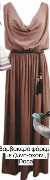
Βαμβακερό φόρεμα με ζώνη-αοινί, Doca