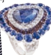
Δαχτυλίδι σε λευκόχρυσο με πολύτιμους λίθους, Thalia Exarchou Jewellery