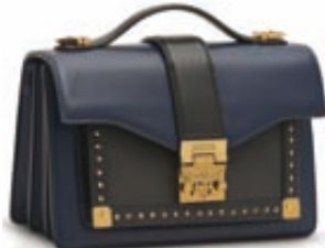
Δερμάτινη τσάντα Mcm, Attica - The Department Store