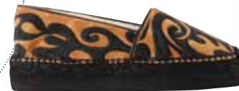
Εσπαντρίγια Miista, Galleria di Scarpe