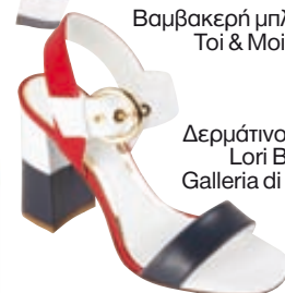
Δερμάτινο πέδιλο Lori Blu, Galleria di Scarpe