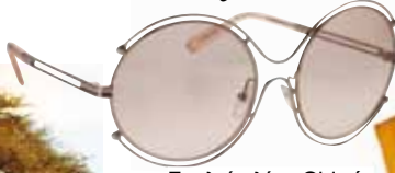
Γυαλιά ηλίου Χλοέ, Οπτικά Προύσαλης