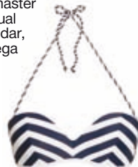
Μπικίνι από τη σειρά Lines, Yamamay