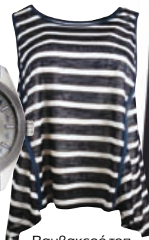
Βαμβακερό топ, Doca