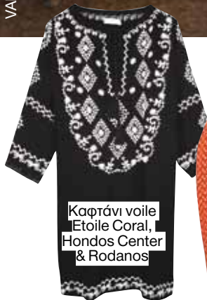
Καρτάνι voile Etóile Coral, Hondos Center & Rodanos

Η έμπνευση έρχεται από τη Μαύρη Ήπειρο και η μόδα αποτύπωσε τα χρώματα της φύσης, όπως το καφέ, το κίτρινο και το μπλε, σε αέρινα υφάσματα, με κίνηση που αφήνουν το σώμα ελεύθερο.