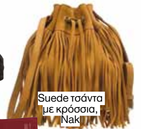
Suede τσάντα με κρόσσια, Nak