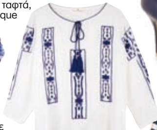
Καφτάνι voile Etoile Coral, Hondos Center & Rodanos