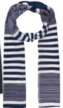
Βαμβακερό φουλάρι, Accessorize