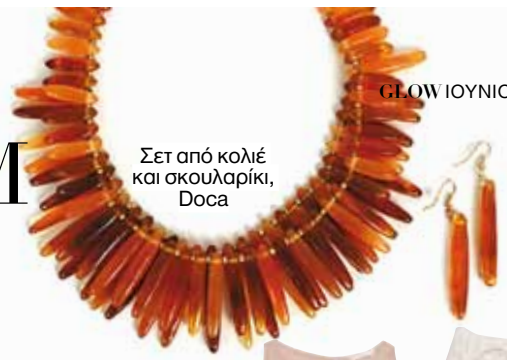
Σετ από κολιέ και σκουλαρίκι, Doca

Το καλοκαίρι έφτασε και το μόνο που ονειρευόμαστε είναι διακοπές σ' εξωτικούς προορισμούς, όπως η αφρικανική γη. Αξεσουάρ από φυσικά υλικά, γραφικά μοτίβα, γήινα χρώματα και αέρινα υφάσματα φέρνουν κοντά μας το σιγί της πείρου που φηλετάρει διαρκώς με τον ήλιο.