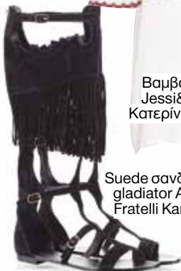
Suede σανδάλια gladiator Ash, Fratelli Karida