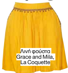
Λινή φούστα Grace and Mila, La Coquette