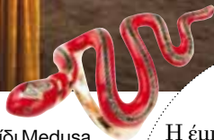
Δαχτυλίδι Medusa Nikos Koulis, Link