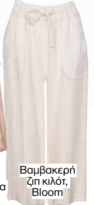
Βαμβακερή ζιπ κιλότ, Bloom