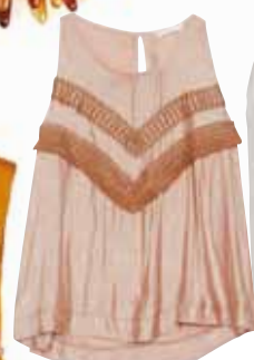
Μεταξωτό τοπ με κεντήματα και κρόσσια Velutto Rosso, Somma