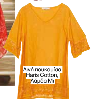
Λινή πουκαμιά Haris Cotton, Λάμδα Μι