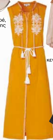
Shirt dress Melissa, Ancient Kallos