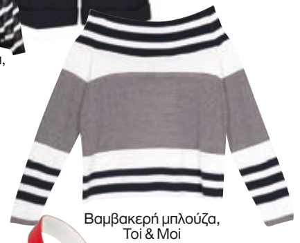
Βαμβακερή μπλουζα, Toi & Moi