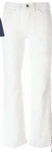
Denim παντελόνι, Diesel