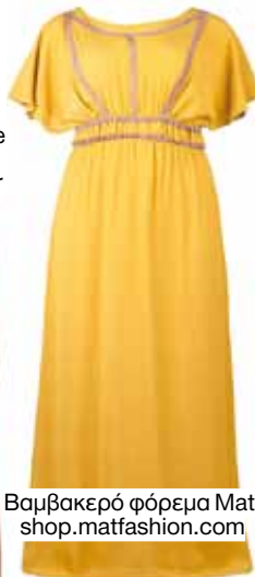
Βαμβακερό φόρεμα Mat, shop.mattfashion.com