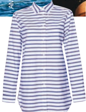
Βαμβακερό πουκάμισο Lauren Ralph Lauren, notosgalleries