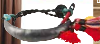
Βραχιόλι classic bobo σε ασήμι 925° με φούντες, Katerina Ioannidis